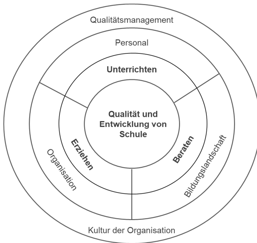
Abb. 1: Handlungsfelder von Schulleitung (nach Huber, 2022, weiterentwickelt seit 2003)

Traditionelle, teilweise veränderte und teilweise neue Aufgaben im Tätigkeitsspektrum von Schulleiter*innen adressieren teilweise unterschiedliche Rollenfacetten schulischer Führung, die nachfolgend in Form von 10 Prämissen ausdifferenziert werden.