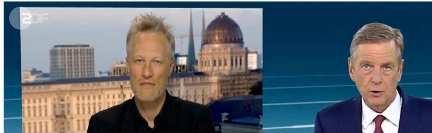
TABLE BILDUNG Wie geht's den Schulen, Herr Huber?